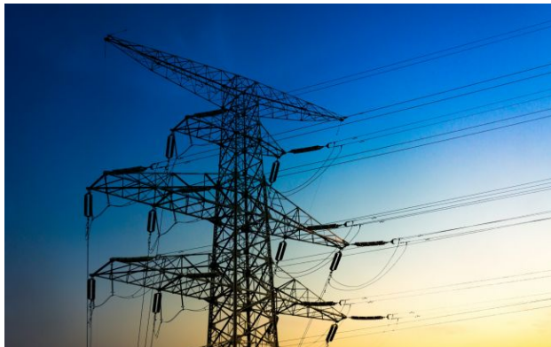
Міненерго виступає за поступове скасування прайс-кепів

Рівень граничних цін (прайс-кепів) на ринку електроенергії вже впливає на баланс енергосистеми, обмежуючи економічну доцільність імпорту ресурсу з Європи.