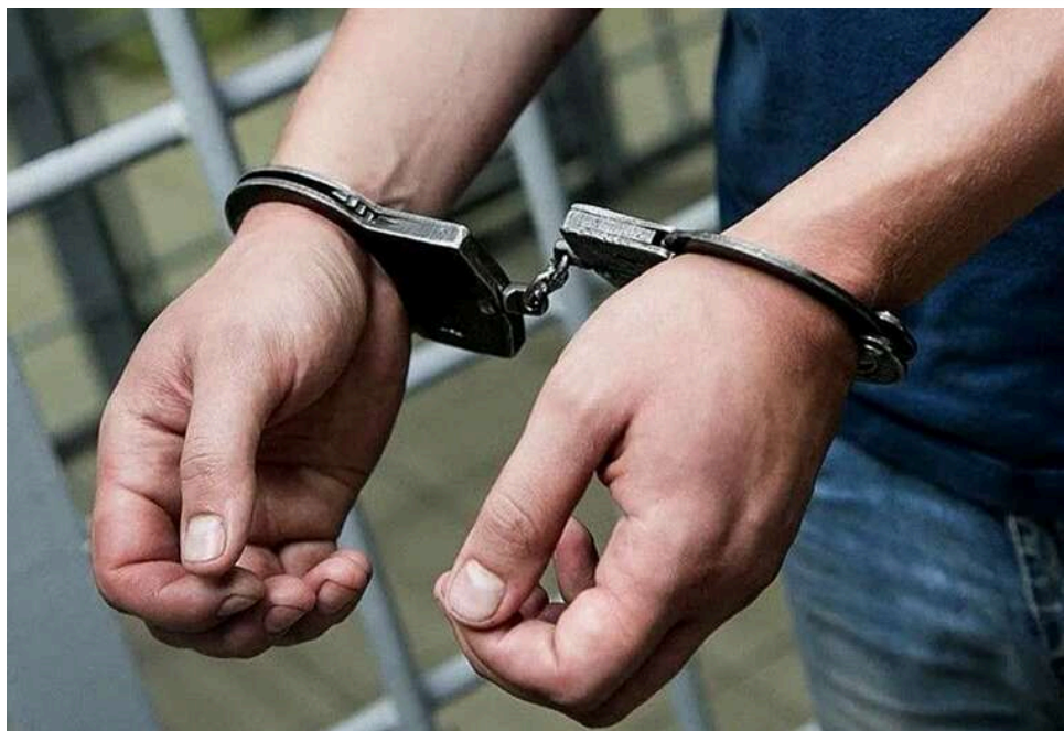
Київський суд засудив чоловіка до довічного ув'язнення за злочини проти малолітньої падчерки

Солом'янський районний суд міста Києва виніс вирок у резонансній справі про сексуальне насильство над дитиною. 07 квітня 2026 року колегія суддів визнала киянина винним у систематичному розбещенні та зґвалтуванні своєї малолітньої падчерки, з якою проживав разом з 2011 року.