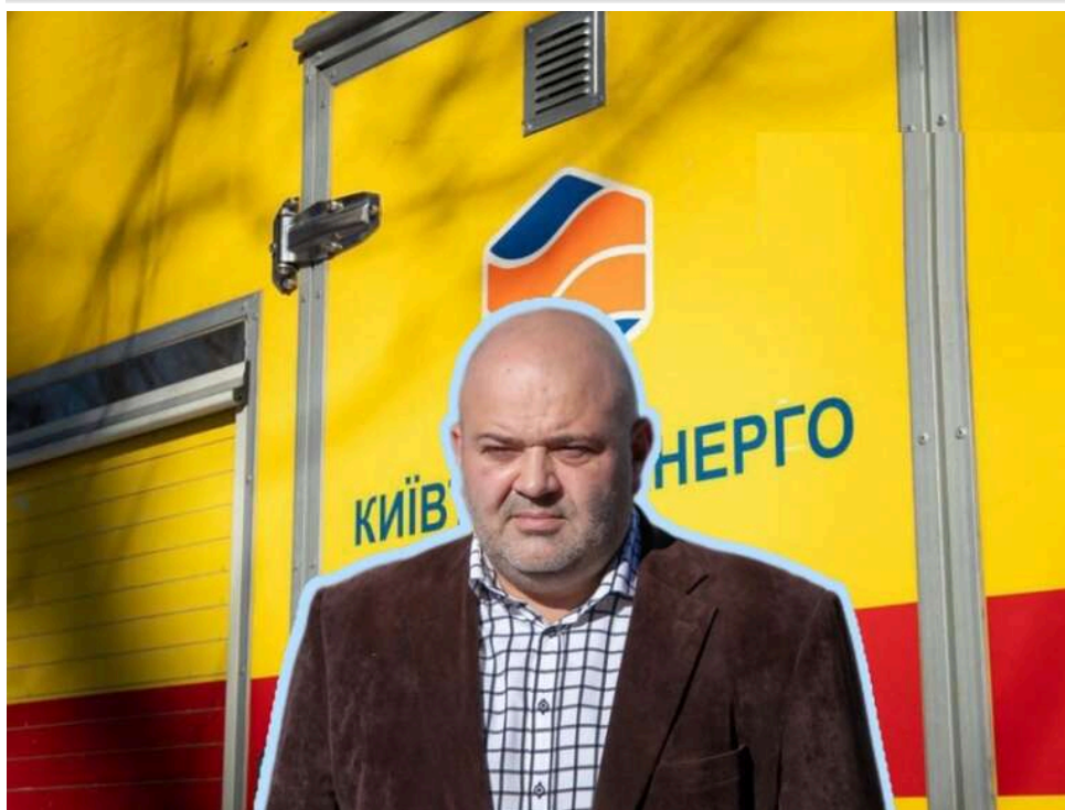
Справа на 60 мільйонів: Нацполіція розслідує нові схеми «Київтеплоенерго» із закупівлею вживаного обладнання

Нацполіція з минулого року розслідує чергову справу щодо ймовірних “бюджетних розпилів” за участі посадовців КП “Київтеплоенерго” та їхніх підрядників і постачальників. Правоохоронців зацікавила співпраця вказаного комунального підприємства як мінімум з чотирма компаніями, з якими уклалися багатомільйонні договори на постачання і монтаж енергетичного обладнання, а також вугілля. Попередньо встановлено, що у “Київтеплоенерго” належним чином не аналізували ціни на ринку, а їхні “приватні партнери”, серед яких слідчі називають і відоме за попередніми справами ТОВ “Атомрембуд”, робили дивні “націнки” на свої товари, що призводило до їхнього здорожчання. За попередніми розрахунками правоохоронців, в результаті через це могло бути втрачено близько 59,7 млн гривень.