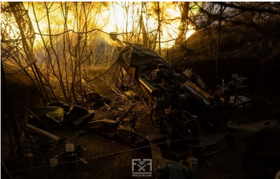
Фото: 148 ОАБр ЗСУ стримують російські атаки на сході і півдні України

Головні зусилля російська окупаційна армія концентрує в районах Костянтинівки і Покровська.