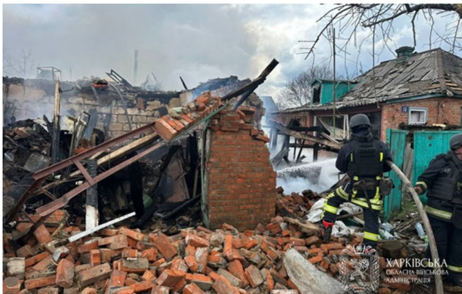
Наслідки російської атаки

Російські війська атакували селище із застосуванням реактивної системи залпового вогню.