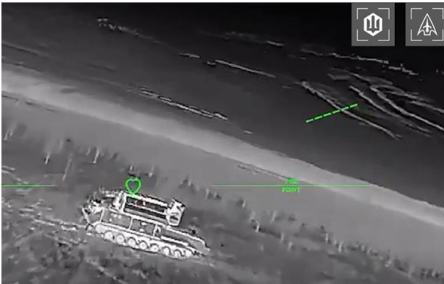
Фото: Скриншот відео СБС уразили дронами логістичний хаб росіян та інші цілі

Також знищено російський ЗРК Тор-М1 та завдано ударів по телекомунікаційних вузлах РФ на Донеччині.