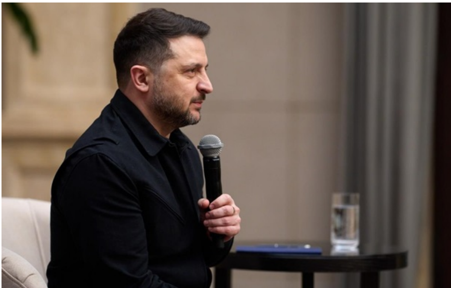
Володимир Зеленський під час поїздки на Закарпаття

Наразі триває робота над гарантіями безпеки для України, оскільки не знайдено відповіді на ключові питання, зазначив президент.