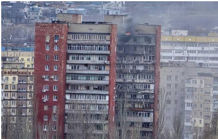
В Днепре шахед попал в 14-этажный дом

В результате атаки БПЛА в 14-этажном доме возникли пожары. Трое человек получили ранения.