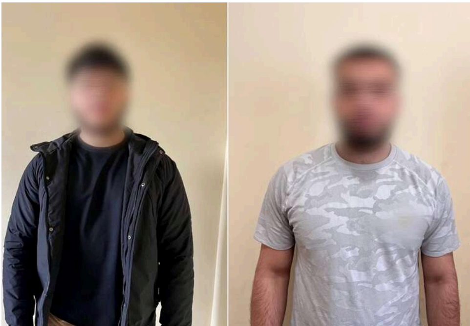
У Білій Церкві чоловіка поранили ножом після конфлікту через великоднє привітання