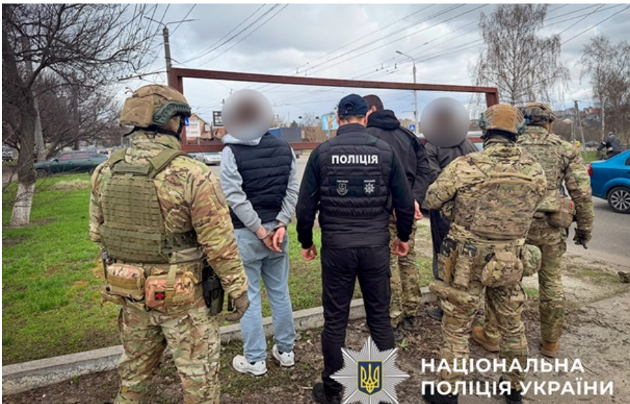
Поліція Сумщини викрила злочинну групу

Зловмисники діяли заздалегідь сплановано, частину майна збували, іншу використовували для власних потреб.