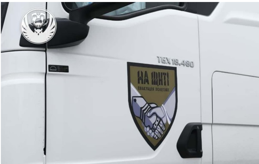
"На щиті" повернулися 1000 героїв

Будуть проведені всі необхідні експертизи та ідентифікація репатрійованих тіл, запевнили в Коордштабі.