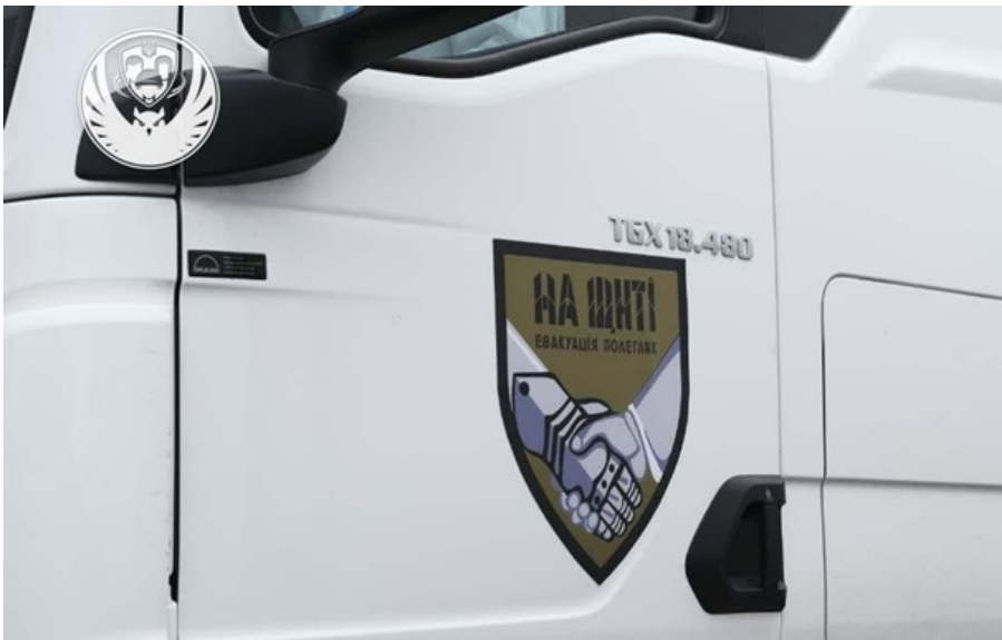
Фото: Координаційний штаб з питань поводження з військовополоненими "На щиті" повернулися 1000 героїв

Будуть проведені всі необхідні експертизи та ідентифікація репатрійованих тіл, запевнили в Коордштабі.