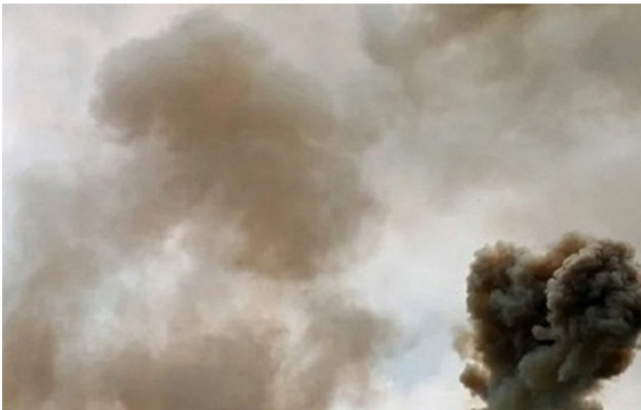
(ілюстративне фото) Росіяни атакували з безпілотною Дніпровський район Херсона

Постраждали двоє працівниць ТЕЦ віком 46 та 49 років. Вони дістали уламкові поранення, контузії, вибухові та закриті черепно-мозкові травми.