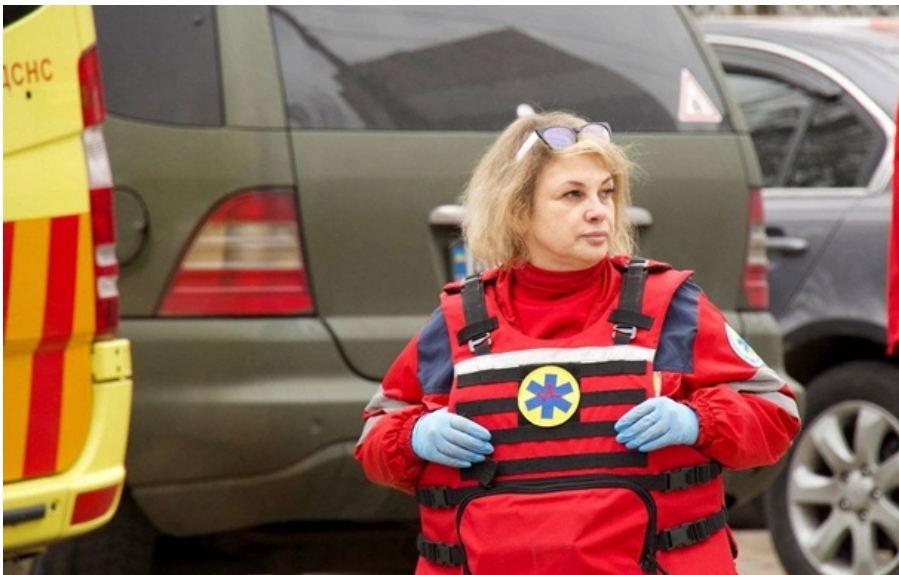
Медики находятся на месте удара в Днепре

Среди пострадавших полуторагодовалый мальчик. Состояние мальчика врачи оценивают как средней тяжести.