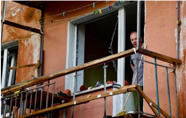
Фото: наслідки атаки на Дніпро 7 травня (t.me/dnipropetrovskaODA)

Обирайте перевірене - додайте РБК-Україна до улюблених джерел у Google