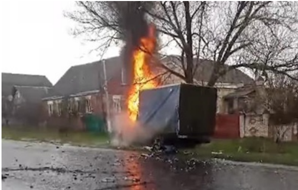
Наслідки влучання російського дрона

Російський FPV-дрон влучив у малотоннажний автомобіль Газель на в'їзді до села, 70-річний водій загинув на місці.