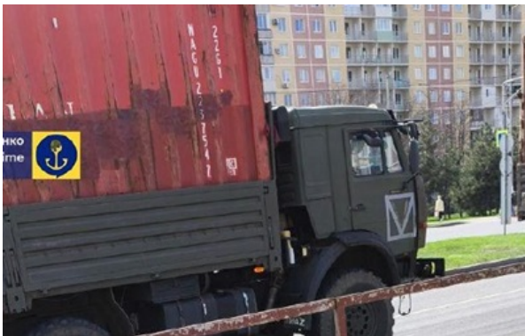
РФ перевозить таємничі контейнери до Бердянська

Контейнери доставляють військовими тягачами та вантажівками з порту Ростов-на-Дону.