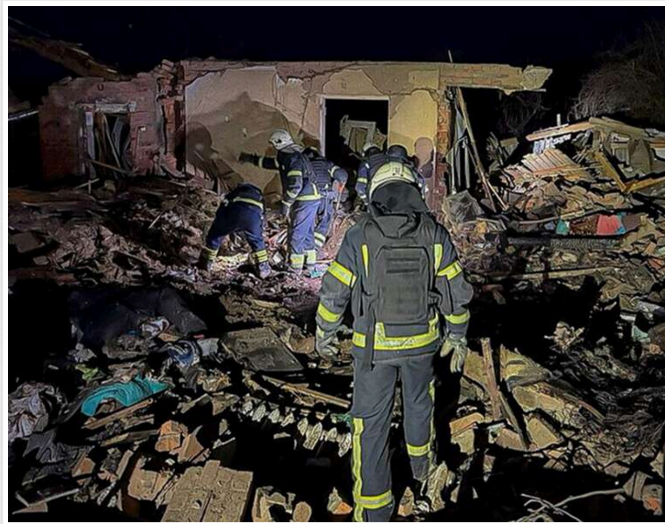
«Працює лише один супермаркет, заправки зачинені»: через цілодобові обстріли жителі масово покидають Богодухів

Останнім часом Росія значно посилила обстріли Богодухова в Харківській області, що спричинило масовий виїзд жителів і початок паніки, повідомляють місцеві жителі в соцмережах і харківські пабліки.