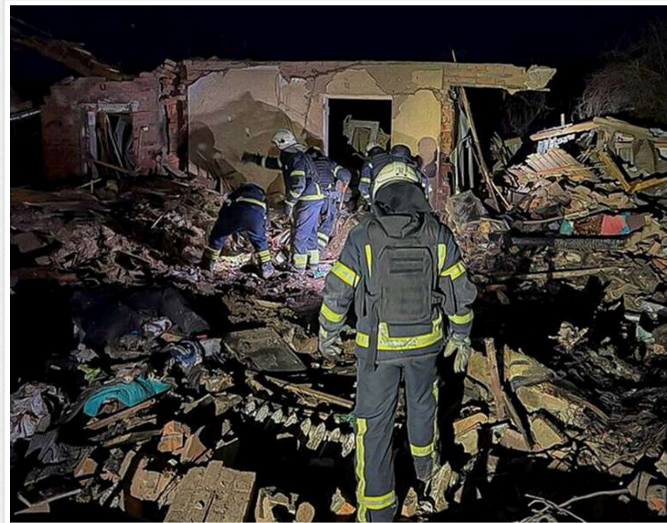
«Працює лише один супермаркет, заправки зачинені»: через цілодобові обстріли жителі масово покидають Богодухів

Читати на руском Read in English Додати як бажане джерело в Google