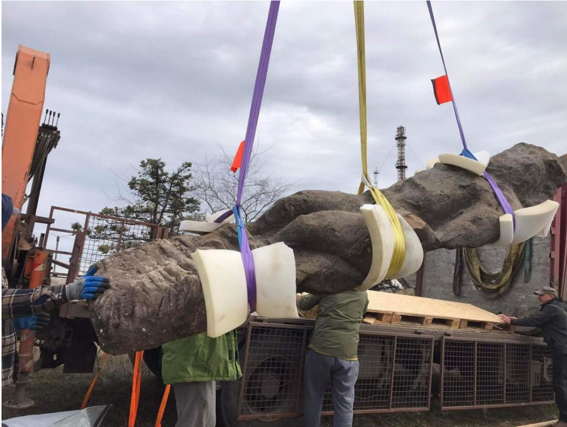
Порятунок кам'яних баб

Більшість із них протягом тривалого часу перебувала поза первісними місцями встановлення – частина зберігалася в музеях або музейних колекціях, частина залишалася в публічному просторі, зокрема на відкритих майданчиках чи символічних локаціях. Наприклад, на горі Кременець в Ізюмі вони довгий час стояли просто неба, навіть були частково укріплені бетоном і сприймалися як символи регіону.