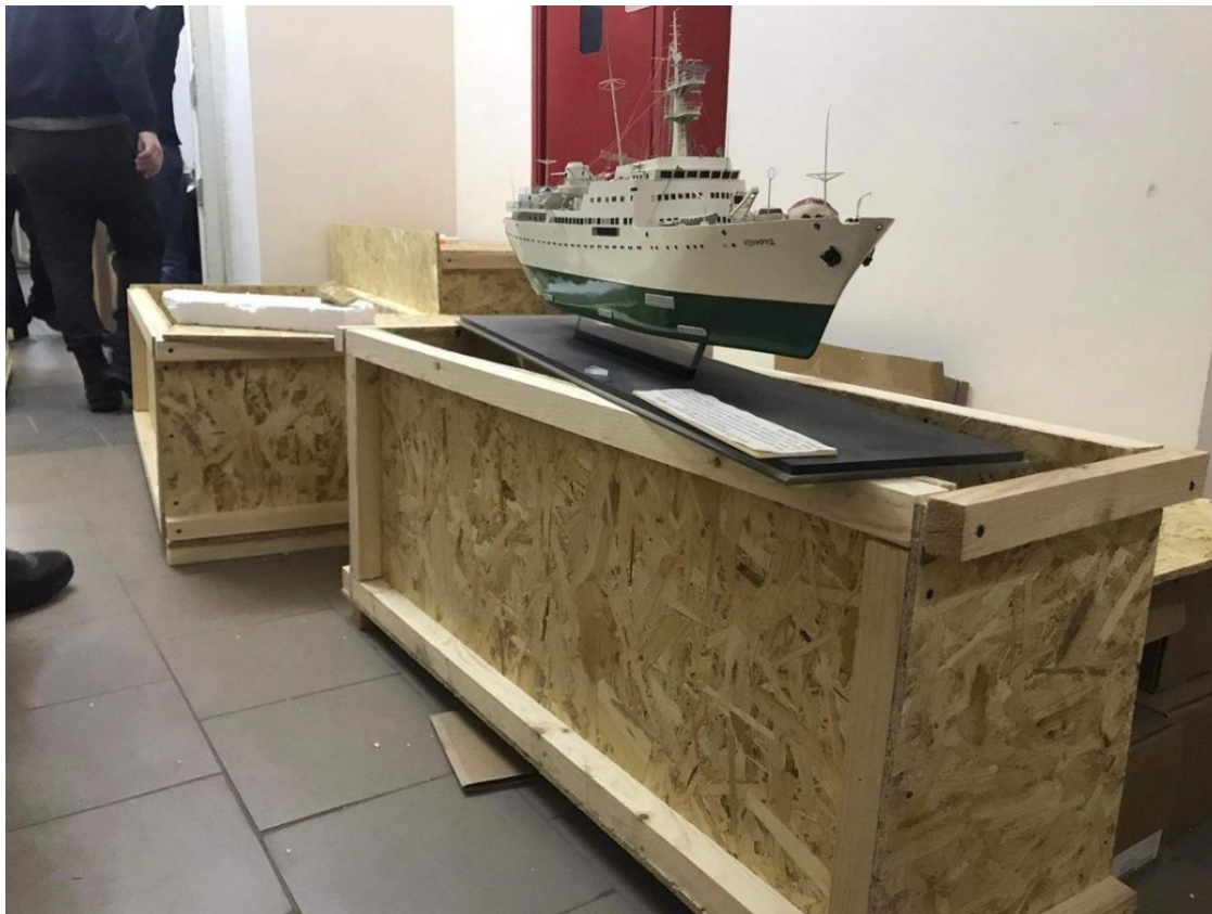
В критичний момент приватникам довелося взяти на себе порятунок історичних цінностей

від самого музею, аби подати запит... Тобто утворилося замкнуте коло.