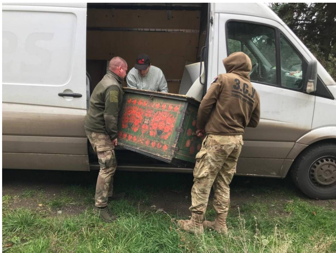
Часом евакуація цінностей проходить буквально під ударами дронів

Щоб максимально убезпечити експонати від подібних ризиків, ми застосовуємо спеціальний процес пакування. Він дає змогу захистити предмети під час транспортування, а також забезпечує можливість швидкого вивантаження чи перевантаження у разі небезпеки. Також ми намагаємося формувати вантаж так, щоб речі не були надто габаритними й за потреби їх можна було оперативно перемістити.