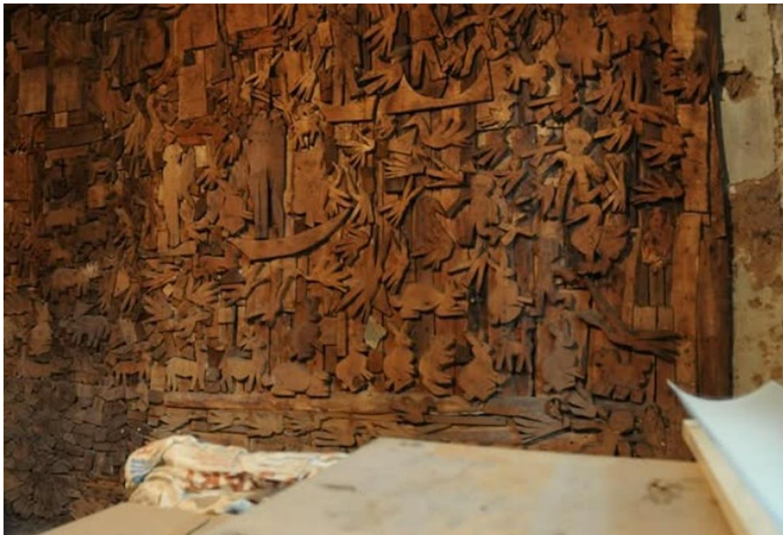
Дерев'яне панно художниці Зінаїди Фоменко