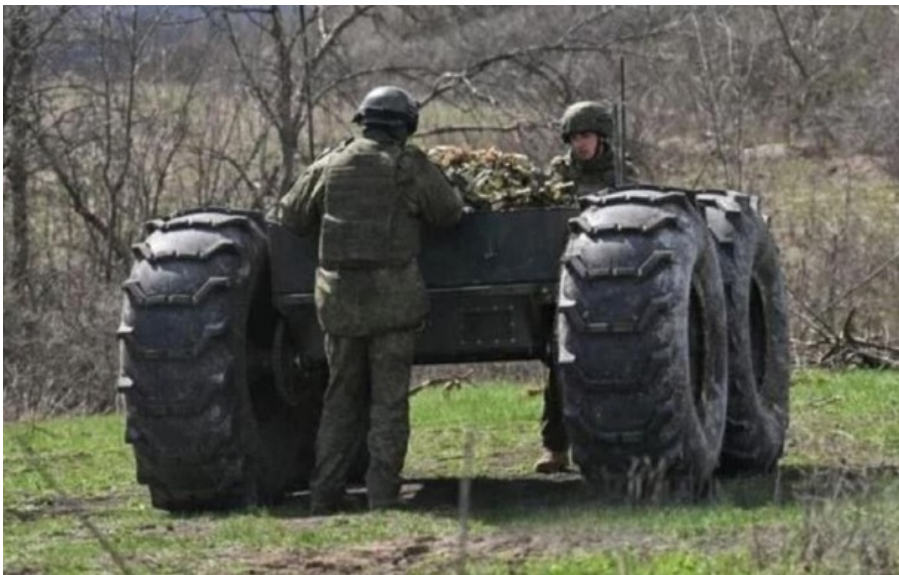
Російський наземний роботизований комплекс Челнок