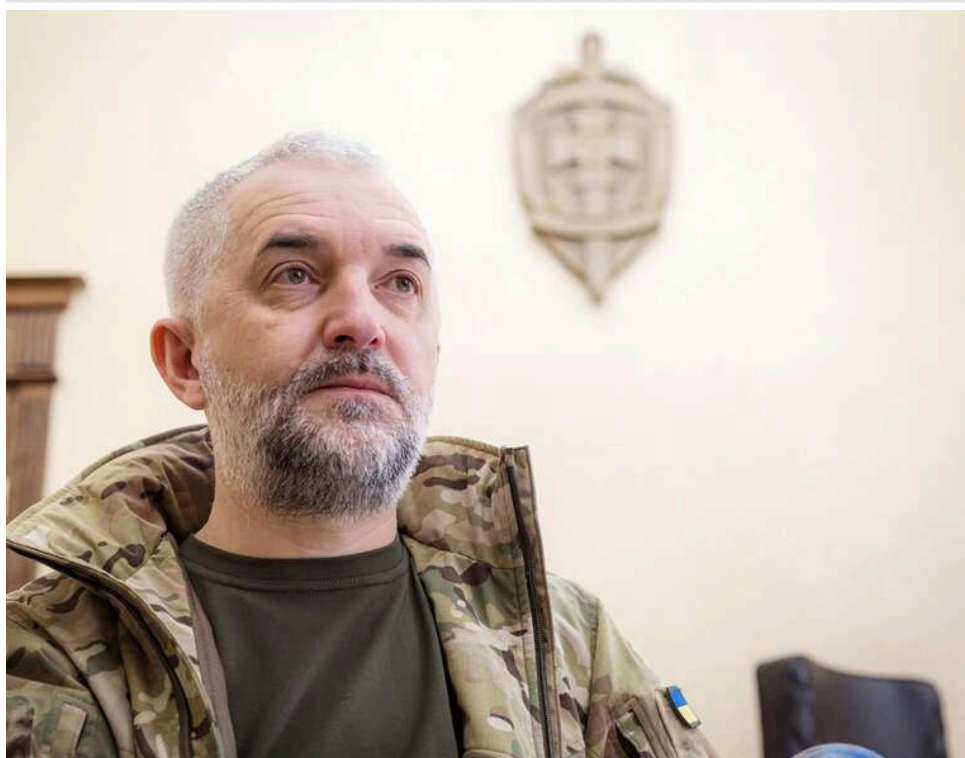
3,3 мільярда збитків і 233 тисячі бракованих мін: СБУ передала до суду справу керівництва Павлоградського хімічного заводу