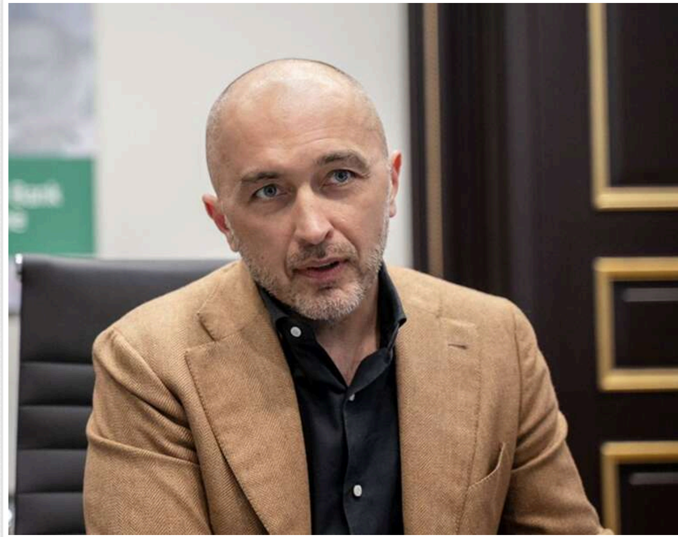
НБУ під прикриттям: як родина Андрія Пишного побудувала паралельну інфраструктуру впливу

У мережі вишло розслідування про бізнес-середовище, сформоване навколо голови Національного банку України Андрія Пишного та його дружини Людмили. Матеріал підготував журналіст одного з центральних телеканалів, проте сюжет не пройшов до ефіру – автор опублікував його анонімно на сторонньому YouTube-майданчику. Сам факт такого шляху публікації є окремим сигналом про умови, в яких працюють українські медіа при висвітленні діяльності керівництва НБУ.