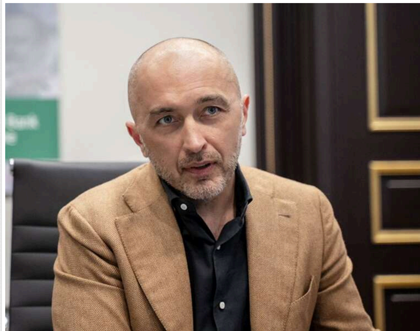
НБУ під прикриттям: як родина Андрія Пишного побудувала паралельну інфраструктуру впливу

У мережі вийшло розслідування про бізнес-середовище, сформоване навколо голови Національного банку України Андрія Пишного та його дружини Людмили. Матеріал підготував журналіст одного з центральних телеканалів, проте сюжет не пройшов до ефіру – автор опублікував його анонімно на сторонньому YouTube-майданчику. Сам факт такого шляху публікації є окремим сигналом про умови, в яких працюють українські медіа при висвітленні діяльності керівництва НБУ.