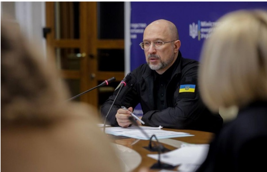
Денис Шмигаль провів засідання Кризового комітету

Відбулось засідання Кризового комітету за участі представників компаній паливно-енергетичного сектору. На ньому і затвердили необхідні обсяги газу.