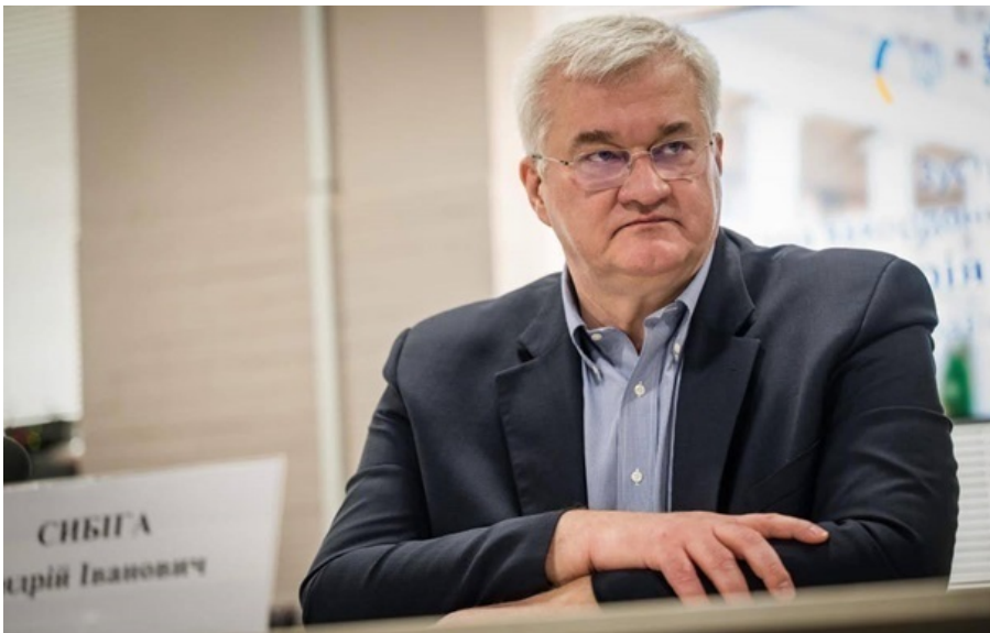
Глава МИД Украины Андрей Сыбига

Вопрос замороженных активов РФ министр назвал неотъемлемой частью усилий по привлечению России к ответственности.