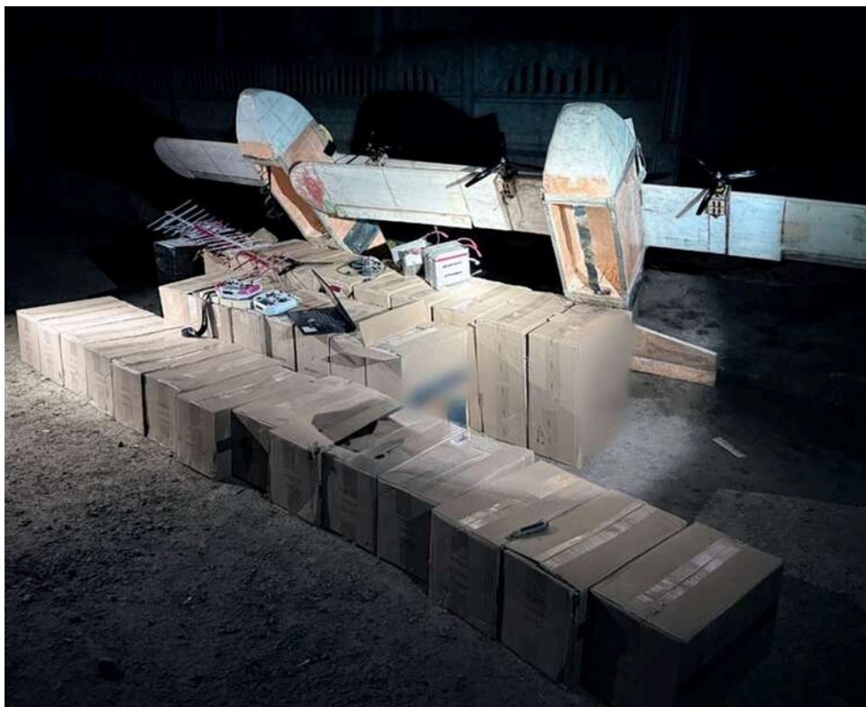
На Буковині БЕБ викрило схему переправлення сигарет через кордон за допомогою БпЛА

Співробітники Територіального управління Бюро економічної безпеки у Чернівецькій області зупинили протиправну діяльність групи осіб, які намагалися незаконно переправити через кордон тютюнові вироби без акцизних марок, використовуючи безпілотні літальні апарати.