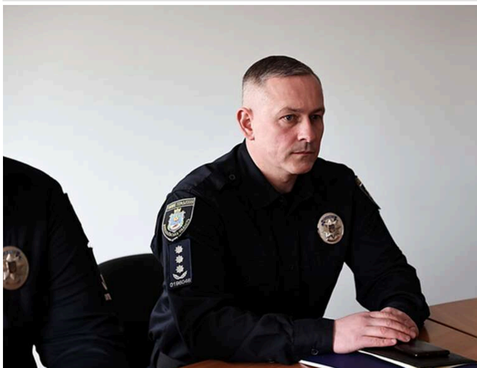
Телефон проти ТЦК: як начальник поліції Южноукраїнська Гавриленко рятує VIP-ухилянтів від повісток

VIP-ухилення за телефонним дзвінком: як голова поліції Гавриленко втручається в процес мобілізації та створює мережу впливу.