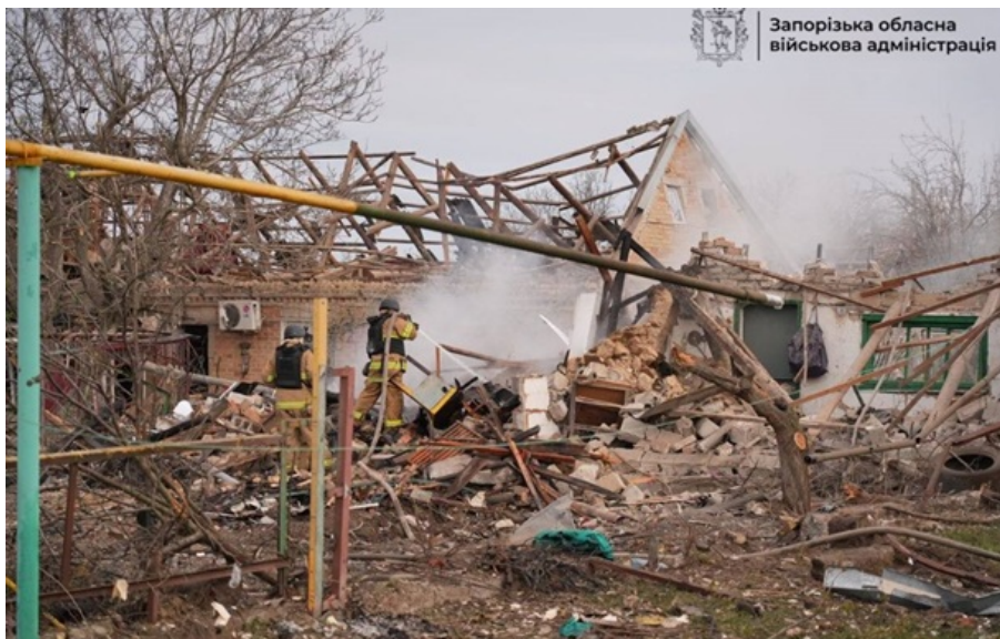
Наслідки удару по Запорізькій області

Внаслідок обстрілу Запорізької області одна людина загинула, ще сім - дістали поранень, в тому числі, дитина.