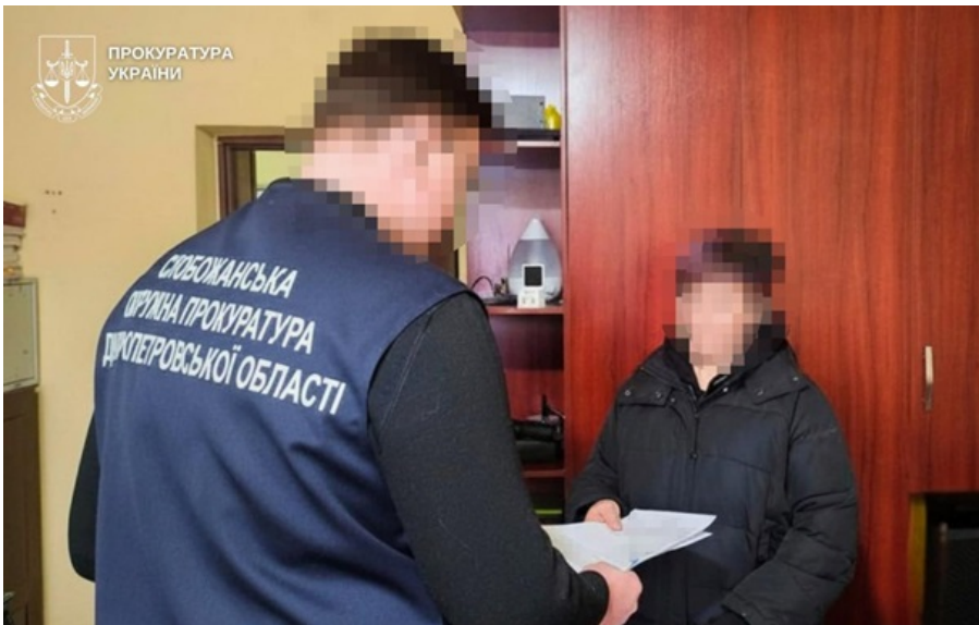
Владелица собаки получила подозрение

Ранее собака неоднократно покидала территорию двора, создавая опасность для окружающих.