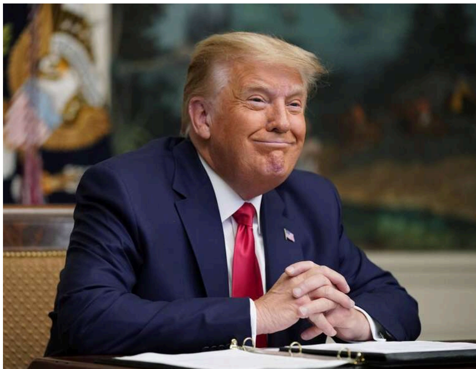
Ціна війни з Іраном: рейтинг Трампа впав до 33% через стрибок інфляції та вартості життя

Рейтинг схвалення економічної політики президента США Дональда Трампа значно знизився за минулий місяць на тлі подорожчання життя, спровокованого війною з Іраном. Навіть республіканці стали менше довіряти його крокам, свідчить свіже опитування AP-NORC.