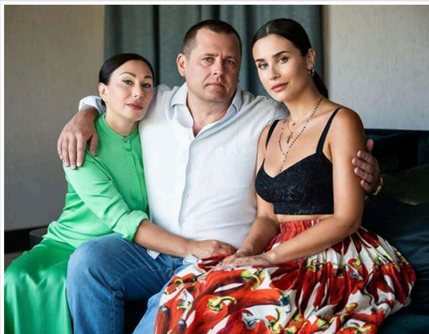
На дочку міського голови Дніпра Бориса Філатова зареєстрована вілла на озері Комо за 8 мільйонів євро

Читати на руськом Read in English Додати як бажане джерело в Google