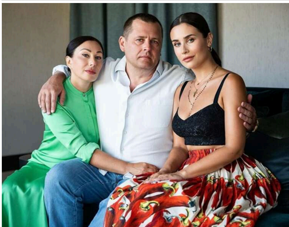
На дочку міського голови Дніпра Бориса Філатова зареєстрована вілла на озері Комо за 8 мільйонів євро

Дочка міського голови Дніпра Бориса Філатова, Катерина, імовірно, є власницею дорогої нерухомості на озері Комо в Італії.