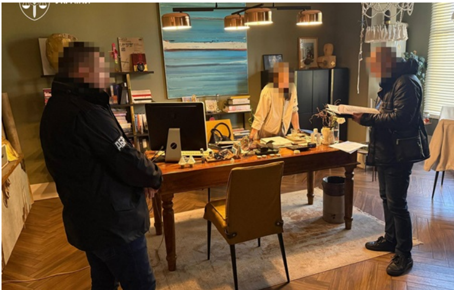
Екскерівник міграційної служби Хмельниччини приховав майно

Йдеться, зокрема, про магазин елітних меблів і три автомобілі - два Audi Q5 та Audi Q8. Після викриття чиновник звільнився з посади.