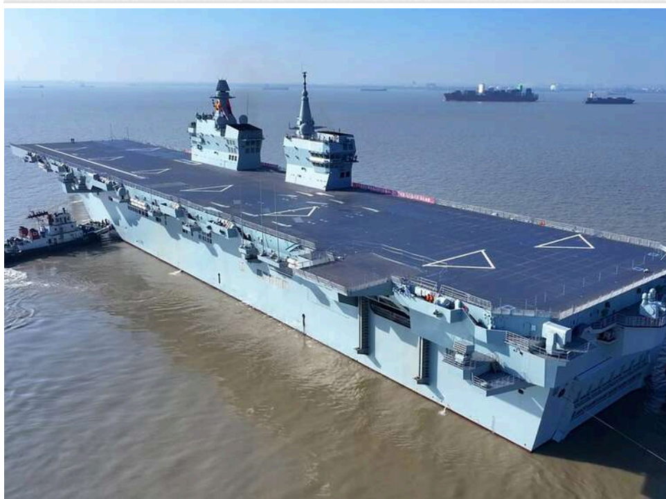
Відповідь на навчання США: Китай відправив новітній «носії дронів» у гарячу точку Південнокитайського моря

Китай направив свій найсучасніший десантний корабель "Сичуань", що відомий як "носії безпілотників", до Південнокитайського моря. Корабель відплив для виконання ключових випробувань у регіоні з високим рівнем військової напруги, коли США та Філіппіни проведуть там свої маневри.