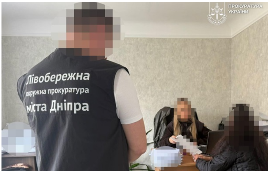
Бухгалтер перевела мошенникам 12 миллионов гривен

Бухгалтер больницы в течение девяти часов общалась с мошенниками в так называемом "чат-боте" одного из банков.