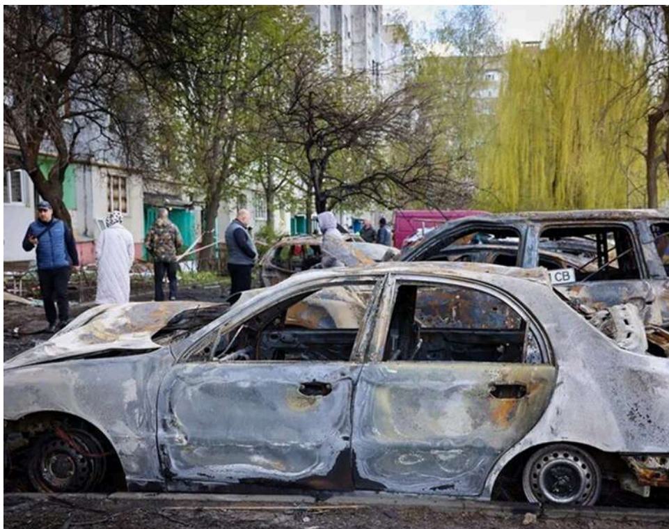
На Сумщині внаслідок масованих атак пошкоджено десятки будинків, серед поранених – 16 дітей

Російські окупанти не припиняють обстріли Сумщини. Через масований удар дронів по селу в Ямпільській громаді спалахнули пожежі та зазнали руйнувань житлові будинки.