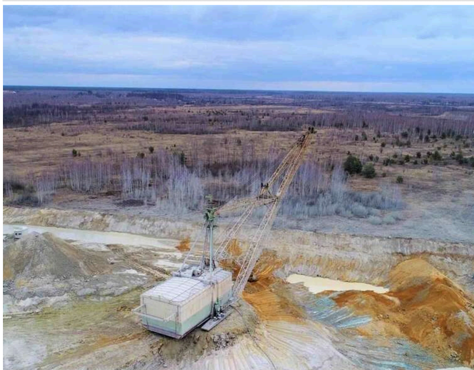
Суд зупинив анулювання дозволу для Межиріченського ГЗК: підприємство відновлює видобуток титану

Дію березневого наказу Державної служби геології та надр України в частині анулювання спеціального дозволу № 2694, наданого ТОВ «Межиріченський ГЗК» для видобування титанових руд Межирічного родовища в Житомирській обл. зупинено.