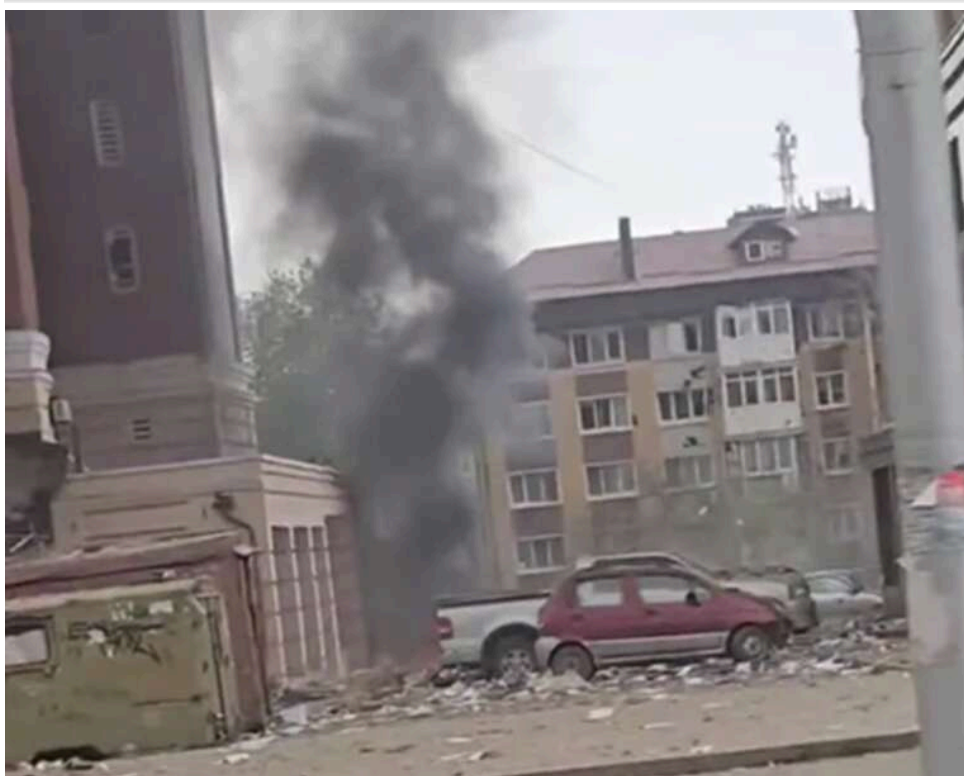
Окупований Донецьк атакував «рій дронів», над містом піднявся чорний дим

У середу, 22 квітня, у тимчасово окупованому Донецьку пролунав ряд вибухів. Через дронову атаку в небо здійнявся стовп чорного диму.