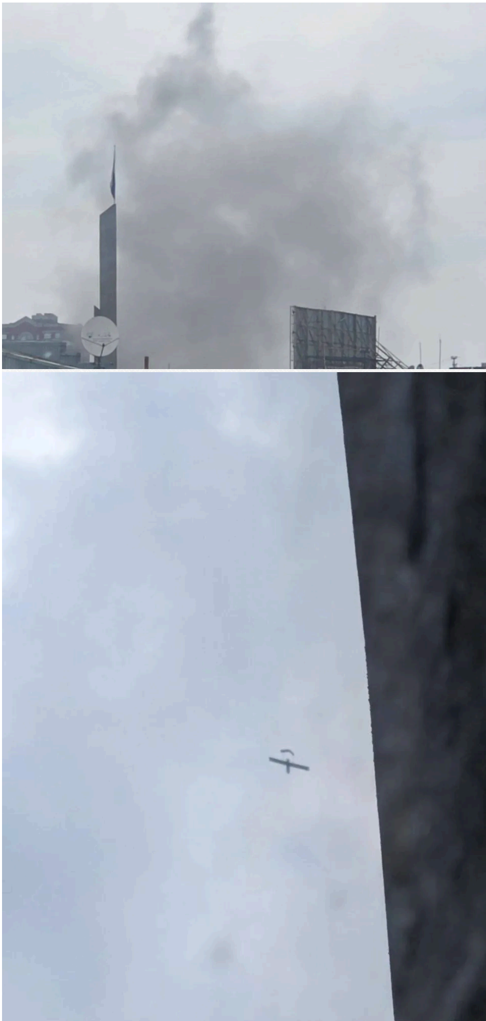
Ранковий удар по Донецьку