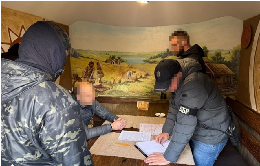
Посадовцю Укрзалізниці загрожує до 12 років позбавлення волі

Заступник керівника одного з департаментів Укрзалізниці вимагав 100 тисяч доларів за демонтаж колії.