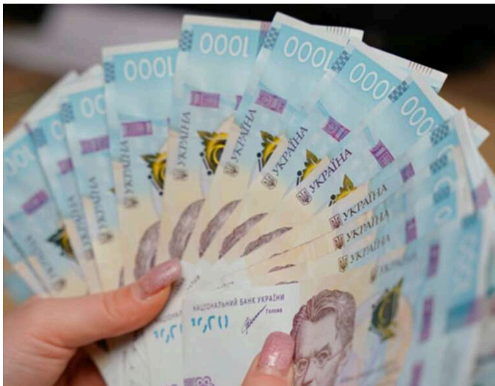
Спадщина та нерухомість замість бізнесу: В Україні живе більше як 3,5 тисячі мільйонерів

В Україні зафіксували понад 3,5 тисячі мільйонерів: у яких регіонах їх найбільше.