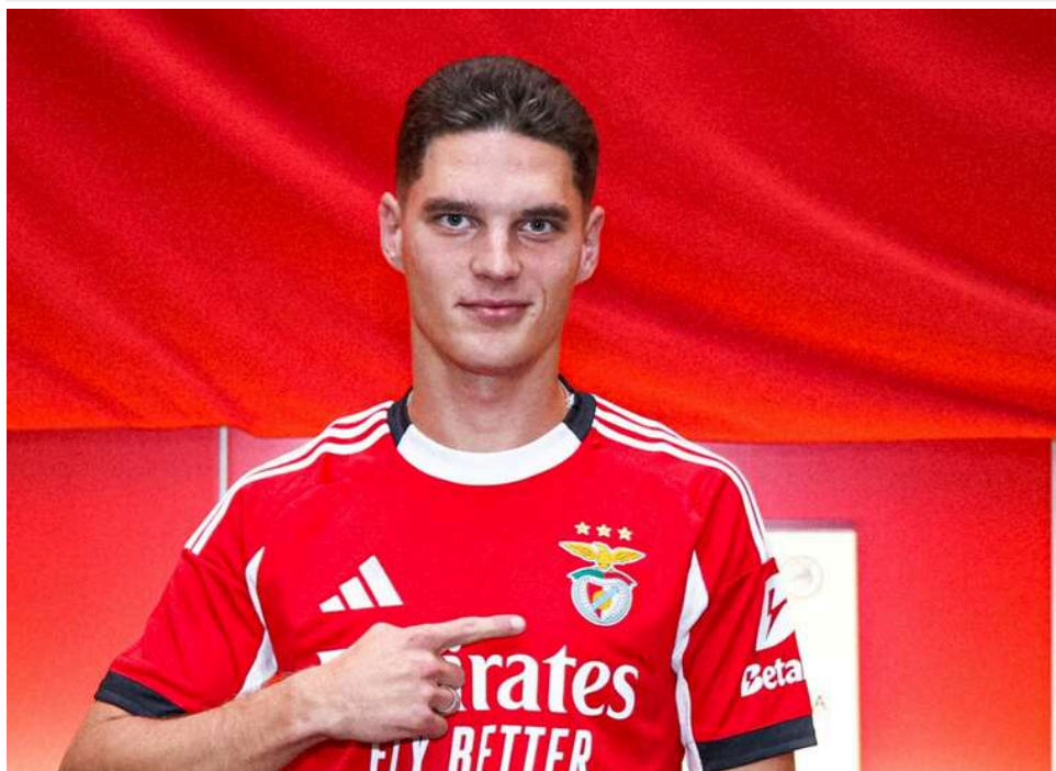
«Бенфіка» може виставити Судакова на трансфер влітку, – ЗМІ