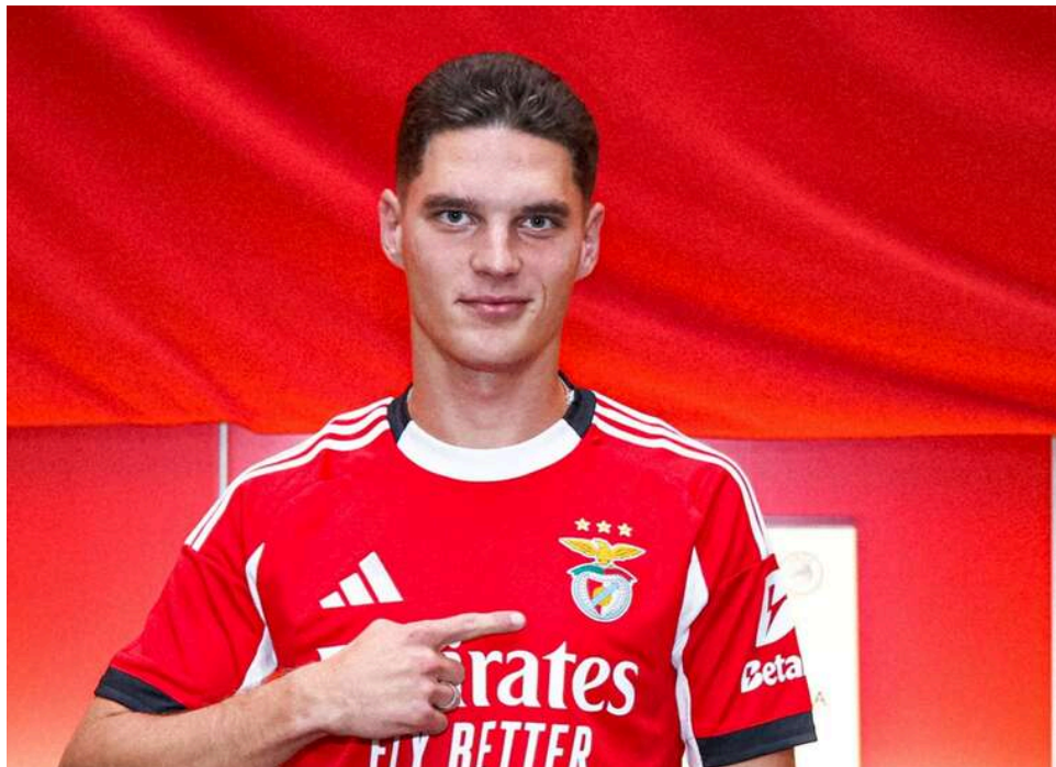
«Бенфіка» може виставити Судакова на трансфер влітку, – ЗМІ

Футболіст не вражає тренерський штаб португальців.