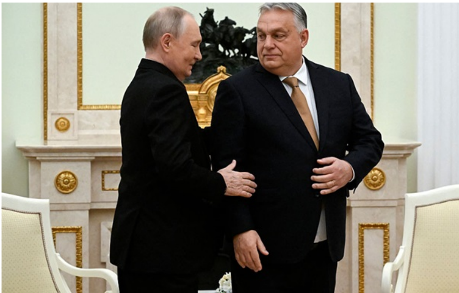
Орбан - агент Путіна в ЄС

Глава МЗС Угорщини Петер Сіярто ділився з главою МЗС РФ Сергієм Лавровим документами щодо вступу України до ЄС.