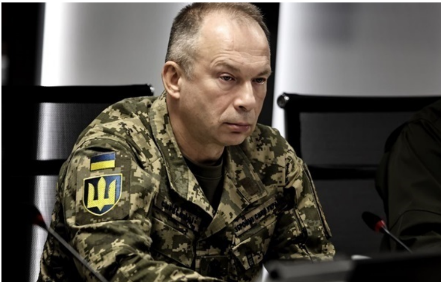
Головнокомандувач ЗСУ Олександр Сирський