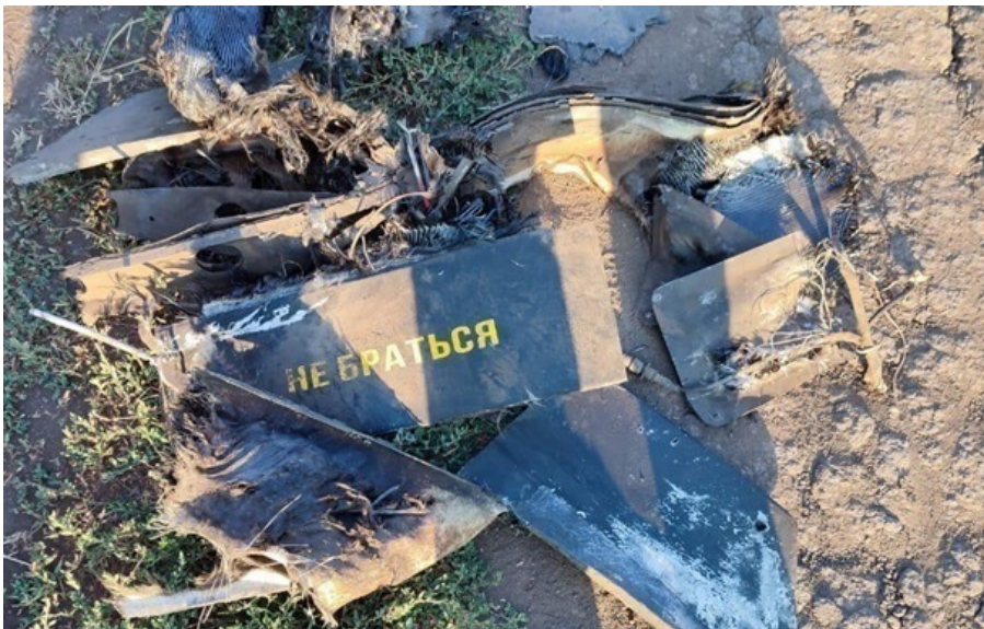
Сили ППО знешкодила 99 зі 119 російських безпілотників

Зафіксовано влучання 16 ударних БПЛА на 11 локаціях, а також падіння збитих (уламки) на чотирьох локаціях.