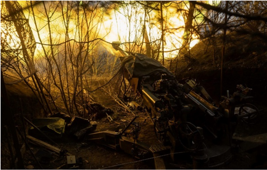
Генштаб розповів про перебіг боїв на фронті

Російські війська найактивніше штурмують три напрямки - Костянтинівський, Покровський, Гуляйпільський.