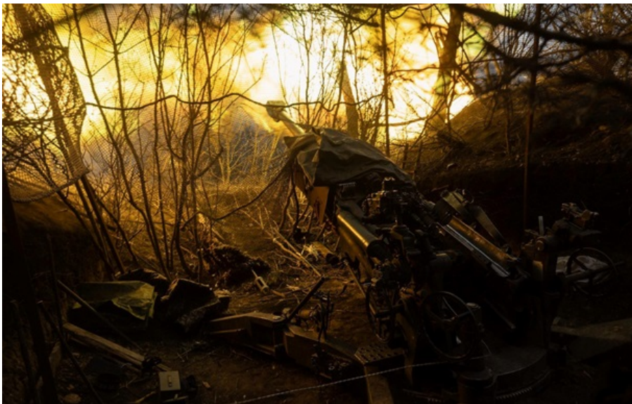
Генштаб розповів про перебіг боїв на фронті

Російські війська найактивніше штурмують три напрямки - Костянтинівський, Покровський, Гуляйпільський.