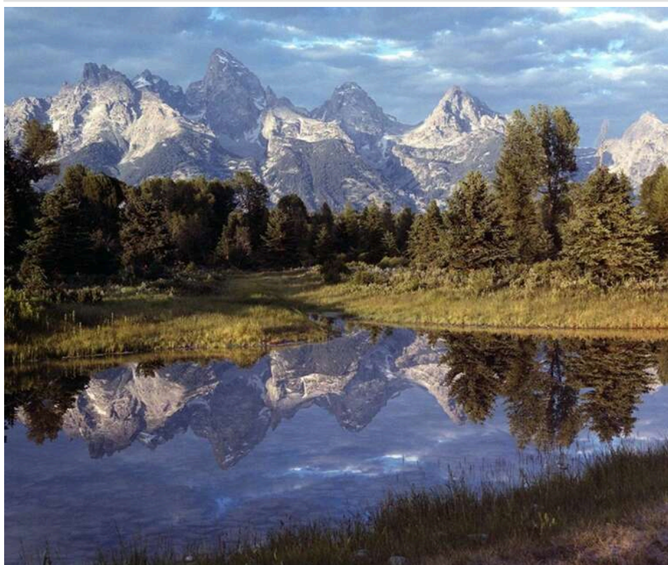
Приватизація дикої природи: як американські мільярдери перетворюють околиці Єллоустона на закритий VIP-заповідник

Американська еліта активно купує закриті ділянки в районі Єллоустона, який перетворюється на один з ключових центрів VIP-нерухомості в США, повідомляє видання In These Times .