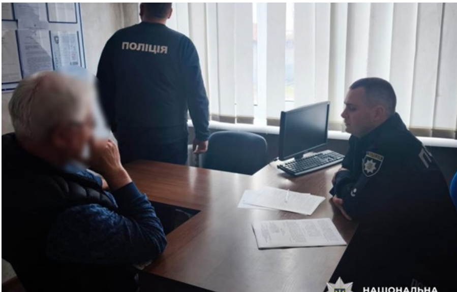
Поліція повідомила про підозру ексначальнику управління тергромади за понад 5 млн грн зайвих витрат з бюджету

Екскерівнику управління Світловодської міської ради інкримінують службову недбалість, що спричинила тяжкі наслідки.